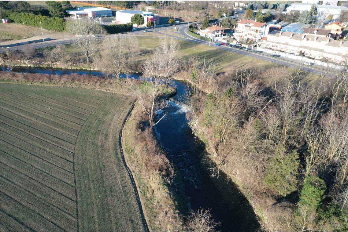
Discontinuità 4 - Vista aerea da valle