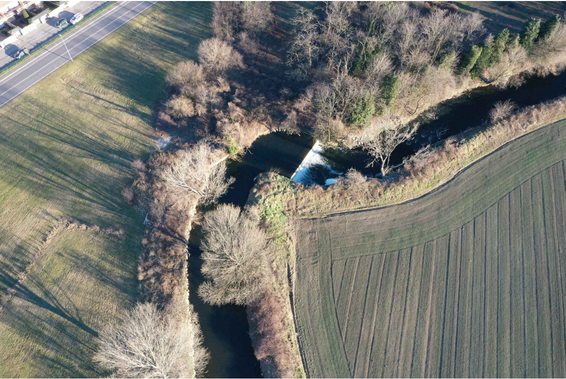
Discontinuità 4 - Vista aerea